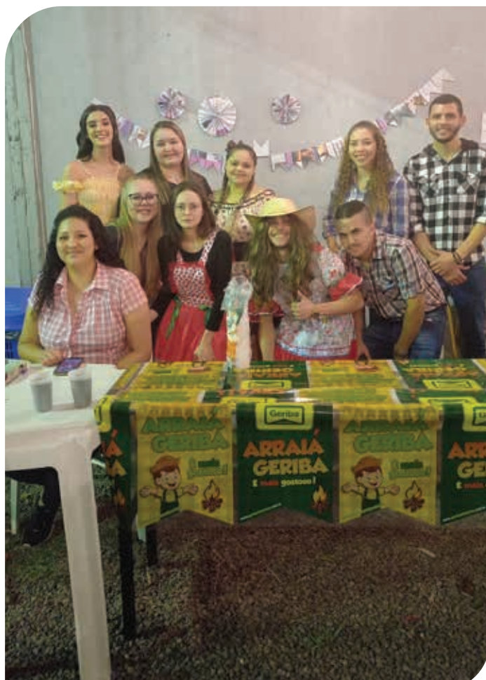
FESTA JULINA - 2022