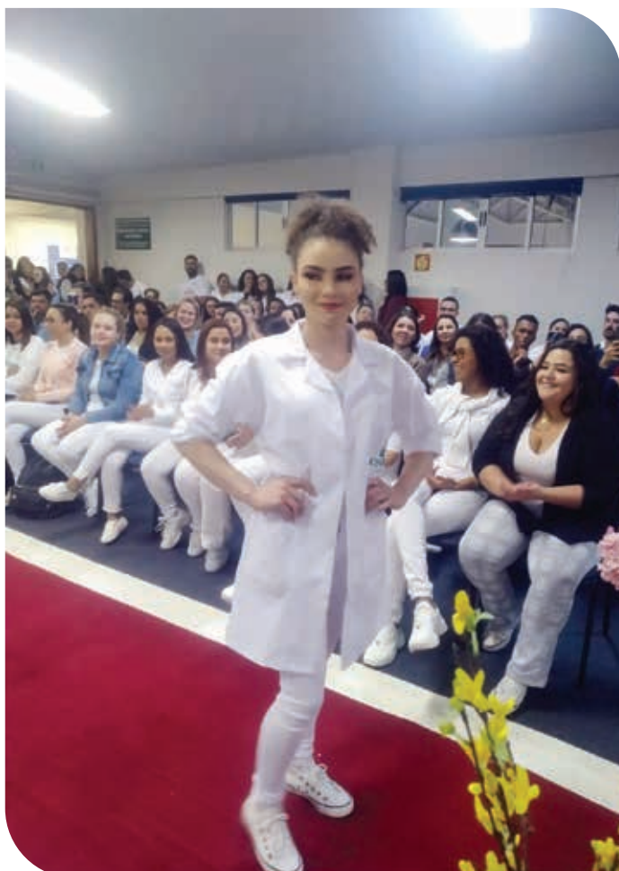
DESFILE - FEIRA DE PROFISSÕES - 2019