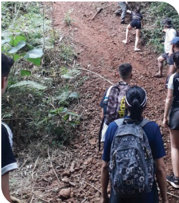
Trilha - 2019

Cenap também está presente em vários eventos, confira: